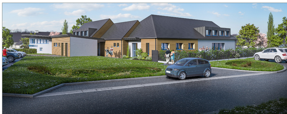
Vue sur l'accès du cabinet