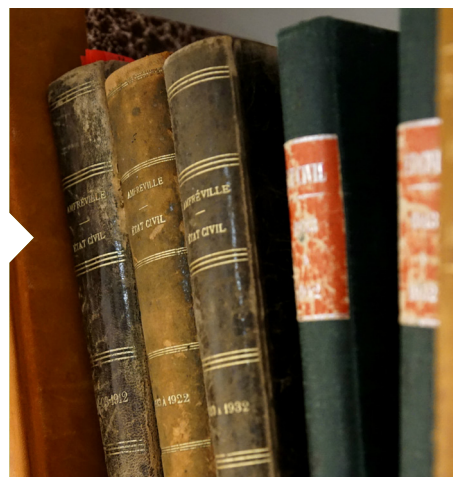
Registres d'État Civil