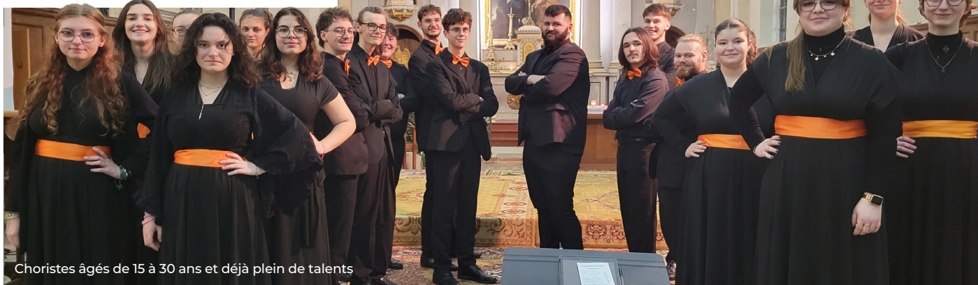
Choristes âgés de 15 à 30 ans et déjà plein de talents